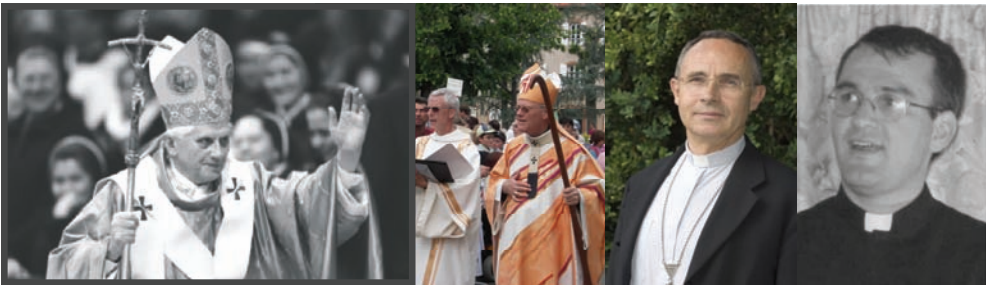
En 2006, la Communauté Chrétienne Solidaire (quêtes impérées)