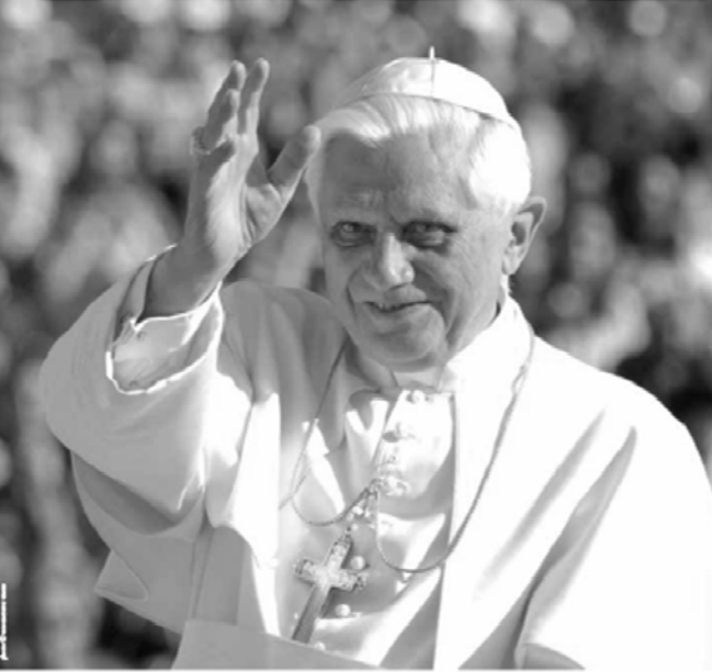
ÉGLISE CATHOLIQUE - WWW.PAPE-FRANCE.ORG

Pour toute information ou toute proposition d'article, merci de contacter :