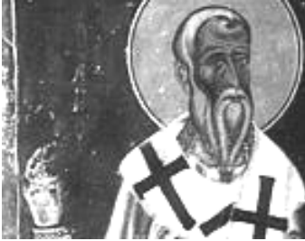
Saint Cyprien (v. 200-258), évêque de Carthage et martyr

Rameaux : Samedi 27 Mars 18h00, à Frouzins. Dimanche 28 Mars, à 9h30 à Villeneuve, à 11h00 à Cugnaux . Messe Chrismale : Lundi 29 avril à 18h30, à la Cathédrale Saint Etienne à Toulouse. Jeudi Saint : 1er avril : à Cugnaux, 19h15 Sainte Cène. (à 18h, Catéchèse des enfants et des adultes) Nuit d'adoration au reposoir, inscriptions dans le fond des églises. Vendredi Saint : 2 avril, à Villeneuve à 19h15. Chemin de Croix : 15h VT, 16h15 CG, 17h30 FR Vigile Pascale , Samedi 3 avril : Frouzins, 20h. Dimanche de Pâques : 9h30 Villeneuve, 11h00 Cugnaux, 18h00 Frouzins.