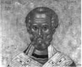
Saint Pierre Chrysologue (v. 406-450), évêque de Ravenne, docteur de l'Eglise

bague au doigt et des sandales aux pieds. Allez chercher le veau gras, tuez-le ; mangeons et festoyons. Car mon fils que voilà était mort, et il est revenu à la vie ; il était perdu, et il est retrouvé. » Après avoir entendu cela, pouvons-nous encore tarder ? Qu'attendons-nous pour revenir au père ?