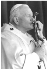
Jean Paul II

Que ce cri soit chargé de toute cette vérité concernant la miséricorde qui a trouvé une si riche expression dans l'Ecriture Sainte et dans la Tradition, comme aussi dans l'authentique vie de foi de tant de générations du peuple de Dieu. Par un tel cri, comme les auteurs sacrés, faisons appel au Dieu qui ne peut mépriser rien de ce qu'il a créé, au Dieu qui est fidèle à lui-même à sa paternité, à son amour !