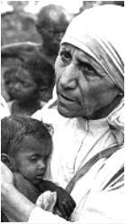
Bienheureuse Teresa de Calcutta (1910-1997)