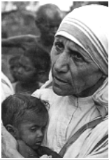
Bx Teresa de Calcutta (1910-1997)

moi. Maintenant que vous avez appris combien Dieu vous aime, quoi de plus naturel pour vous que de passer le reste de votre vie à rayonner de cet amour ? Être vraiment chrétien, c'est accueillir vraiment le Christ et devenir un autre Christ. C'est aimer comme nous sommes aimés, comme le Christ nous a aimés sur la croix.