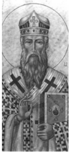
Saint Maxime de Turin (?-v. 420), évêque

Vraiment, il est notre aujourd'hui, quand, jailli de la nuit épaisse des enfers, il embrase les hommes. Vraiment, il est notre jour, celui que les noirs complots de ses ennemis n'ont pas pu obscurcir. Nul jour mieux que ce jour n'a su accueillir la lumière : à tous les morts, il a rendu et le jour et la vie. La vieillesse avait étendu les hommes dans la mort ; il les a relevés dans la vigueur de son aujourd'hui.