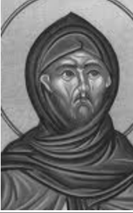
Saint Ephrem (v. 306-373), diacre en Syrie, docteur de l'Eglise

« De même que le Père m'a envoyé, moi aussi je vous envoie »