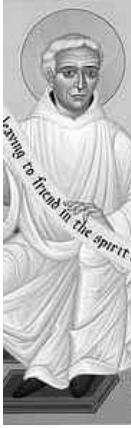
Saint Aelred Rielvaux (1110-1167) Moine cistercien

mauvais, et pleuvoir sur les justes et sur les injustes » ? (Mt 5,45) Tout cela se trouve dans la charité, et rien que dans la charité. C'est de même en elle que résident la vraie tranquillité, la vraie douceur, car c'est elle le joug du Seigneur. Si, à l'invitation du Seigneur, nous le portons, nous trouverons le repos pour nos âmes, car « le joug du Seigneur est doux et son fardeau léger ». C'est que « la charité est patiente, elle est serviable, elle ne s'enfle pas, elle n'agit pas de travers, elle n'est pas ambitieuse » (1Co 13,4-5). Les autres vertus sont pour nous comme un véhicule pour un homme fatigué, ou comme la nourriture pour un voya-