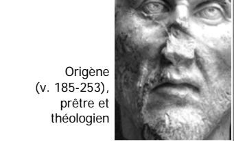
Origène (v. 185-253), prêtre et théologien

forme de commerce et à cause du zèle du Verbe, la Parole de Dieu, qui est présent en eux, ses disciples seront « détruits » pour être « relevés » par Jésus en trois jours... Car il faut trois jours entiers pour que cette reconstruction soit achevée. C'est pourquoi l'on peut dire d'une part que la résurrection a eu lieu et d'autre part qu'elle est à venir : vraiment « nous avons été ensevelis avec le Christ » et « avec lui nous nous leverons » (cf Rm 6,4)... « Tous revivront dans le Christ, mais chacun à son rang : comme prémices, le Christ, puis ceux qui seront au Christ sors de son avènement » (1Co 15,22s).