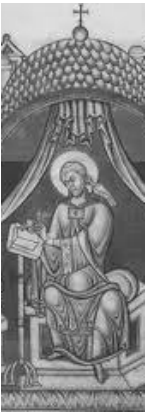
Basile de Séleucie (?-v. 468), évêque

Le Seigneur réapparaît et dissipe à la fois la tristesse et le doute de son disciple. Que dis-je ? Il ne dissipe pas son doute, il comble son attente. Il entre, toutes portes closes.