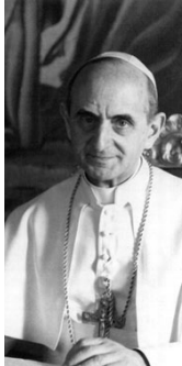
Paul VI, pape de 1963-1978

rons face à face ? Lorsque tous les membres du Corps du Christ feront jaillir une hymne d'exultation, à flots débordants, glorifiant celui qui les aura ressuscités des morts et leur aura fait le don de la vie éternelle ?... Que ne fera pas la grâce entière de l'Esprit, enfin donnée aux hommes par Dieu ? Elle nous rendra semblables à lui et accomplira la volonté du Père, car elle rendra l'homme à l'image et à la ressemblance de Dieu » (Irénee de Lyon; 2Co 5,5; Ga 4,6; 1Co 13,12; Gn 1,26). Dès ici-bas les saints nous donnent un avant-goût de cette ressemblance.