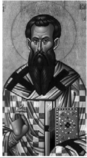
Saint Basile (v. 330-379), moine et évêque de Césarée

cesse à partir de sa substance, uni au Père de toute éternité, égal à lui en bonté, égal en puissance, partageant sa gloire... Et quand notre intelligence aura été purifiée des passions terrestres et qu'elle laisse de côté toute créature sensible, tel un poisson qui émerge des profondeurs à la surface, rendue à la pureté de sa création, elle verra alors l'Esprit Saint là où est le Fils et où est le Père. Cet Esprit, étant de même essence selon sa nature, possède lui aussi tous les biens : bonté, droiture, sainteté, vie... De même que brûler est lié au feu et resplendir à la lumière, ainsi on ne peut ôter à l'Esprit Saint le fait de sanctifier ou de faire vivre, pas plus que la bonté et la droiture.