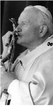
Bienheureux Jean Paul II

Vierge Sainte, Mère du Rédempteur, guide assuré dans le chemin vers Dieu et le prochain, toi qui as conservé ses paroles dans l'intimité de ton cœur (Lc 2,19), soutiens par ton intercession maternelle les familles et les communautés ecclésiales, afin qu'elles aident les adolescents et les jeunes à répondre généreusement à l'appel du Seigneur. Amen.