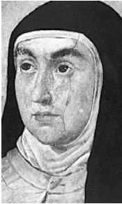
Sainte Thérèse d'Avila (1515-1582), carmélite, docteur de l'Eglise

cher pour comprendre cela... Oui, approchez de lui, mes filles, mais songez et comprenez à qui vous allez parler, ou à qui vous parlez déjà. Après mille vies comme la nôtre vous n'arriverez pas encore à comprendre les égards que mérite un tel Seigneur, devant qui tremblent les anges. Il commande tout, il peut tout ; pour lui, vouloir c'est faire. Il est juste, mes filles, que nous cherchions à nous réjouir des grandeurs de notre Époux, que nous comprenions de qui nous sommes les épouses, et donc que nous sachions quelle doit être la sainteté de notre vie.