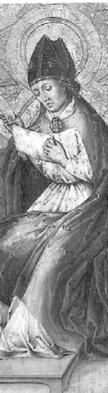
Saint Ambroise (v. 340-397), évêque de Milan et docteur de l'Eglise

pays de mort, une lumière se lève sur toi ». Bois donc sans plus attendre, et une grande lumière t'éclairera : non plus la lumière quotidienne du jour, du soleil ou de la lune, mais cette lumière qui repousse l'ombre de la mort.