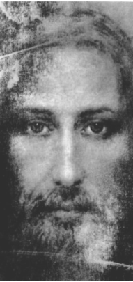
Asterius d'Amasée (2 e -v. 410), évêque

enseignent des mystères sacrés. Ne désespérons pas facilement des hommes, ne laissons pas à l'abandon ceux qui sont en péril. Recherchons avec ardeur celui qui s'est égaré, ramenons-le sur le chemin, réjouissons-nous de son retour et réintégrons-le dans la communauté de ceux qui vivent en vrais fidéles.