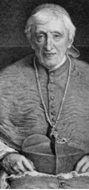
Bienheureux John Henry Newman (1801-1890), théologien

reins, et le Christ s'y fait entendre, de sa « voix douce et tranquille » (1R 19,12), parce que le monde ne parle plus. Dépouillons-nous seulement du monde, et nous revêtrons le Christ (Ep 4,22; Rm 13,14)... Puissions-nous, en nous dévêtant ainsi, nous revêtir de choses invisibles et impérissables ! Puissions-nous grandir en grâce et dans la connaissance de notre Seigneur et Sauveur, saison après saison, année après année, jusqu'à ce qu'il nous prenne avec lui...dans le Royaume de son Père et notre Père, de son Dieu et notre Dieu (Jn 20,17).