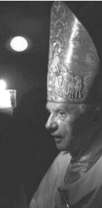
Benoît XVI, pape de 2005 à 2013

nous tous. Mais comment cela peut-il arriver ? Comment tout cela peut-il parvenir jusqu'à nous de façon que cela ne reste pas seulement parole, mais devienne une réalité dans laquelle nous sommes impliqués ? Par le sacrement du baptême et la profession de foi, le Seigneur a construit un pont vers nous, par lequel le nouveau jour vient à nous. Dans le baptême, le Seigneur dit à celui qui le reçoit... : « Que la lumière soit ». Le nouveau jour, le jour de la vie indestructible vient aussi à nous. Le Christ te prend par la main. Désormais tu seras soutenu par lui et tu entreras ainsi dans la lumière, dans la vraie vie.