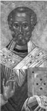
Saint Pierre Chrysologue (v. 406-450), évêque de Ra- venne, docteur de l'Eglise

Les autres viennent avec la barque, en trainant leur filet plein de poissons. Avec beaucoup de peine ils ramènent avec eux l'Eglise jetée dans les vents du monde. C'est elle que ces hommes emportent dans le filet de l'Evangile vers la lumière du ciel et qu'ils arrachent aux abîmes pour la conduire auprès du Seigneur.