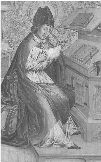
Saint Ambroise (v. 340-397), évêque de Milan et docteur de l'Eglise

dépouiller, comme Adam, privé de la protection du commandement de Dieu et dépourvu du vêtement de la foi. Voilà pourquoi il a reçu la blessure mortelle à laquelle tout le genre humain aurait succombé, si le Samaritain n'était descendu guérir ses blessures affreuses. Ce n'est pas n'importe qui, ce Samaritain : celui que le prêtre et le lévite avaient dédaigné, lui ne l'a pas dédaigné... Ce Samaritain descendait : « Qui est descendu du ciel, sinon celui qui est monté au ciel, le Fils de l'homme, qui est au ciel ? » (Jn 3,13) Voyant à demi mort cet homme que personne avant lui n'avait pu guérir..., il s'est approché de lui ; c'est-à-dire qu'en acceptant de souffrir avec nous, il s'est fait notre prochain et qu'en exerçant la miséricorde envers nous, il s'est fait notre voisin.