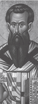
Saint Basile (v. 330-379), moine et évêque de Césarée en Cappadoce, docteur de l'Eglise

comble ce que tu as bâti mal-honnêtement. Laisse s'écrouler tes réserves de blé qui n'ont jamais soulagé personne. Fais disparaître tout bâtiment qui abrite ton avarice, enlève les toits, renverse les murs, expo-se au soleil le blé qui moisit, sors de leur prison les riches-ses qui y étaient captives... « Je vais démolir mes gre-niers et j'en rebâtirai de plus grands. » Une fois que tu les auras remplis à leur tour, que vas-tu décider ? Les démoli-ras-tu pour en rebâtir d'autres une fois encore ? Y a-t-il pire folie que de se tourmenter