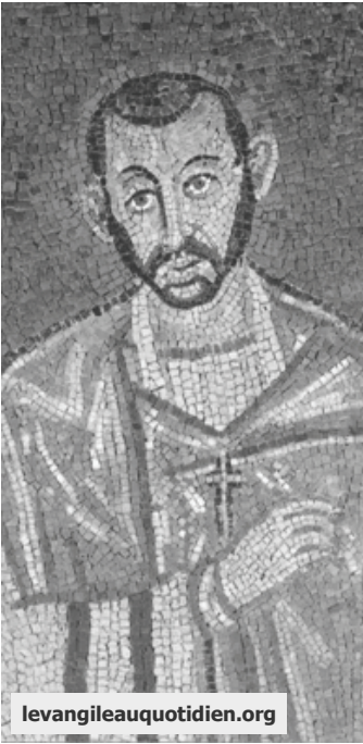
Saint Ambroise de Milan Evêque et Docteur de l'Eglise.

remettant aux autres au nom de son maître, il s'est ménagé des appuis. Et Jésus a très bien parlé de « l'argent trompeur », parce que l'amour de l'argent tente nos penchants par ses séductions variées au point que nous acceptions d'en être les esclaves. C'est pourquoi il dit : « Si vous n'avez pas été dignes de confiance pour des biens étrangers, le vôtre, qui vous le donnera ? » Les richesses nous sont étrangères parce qu'elles sont en dehors de notre nature ; elles ne naissent pas avec nous, elles ne nous suivent pas dans la mort. Le Christ, au contraire, est à nous parce qu'il est la vie... Ne soyons donc pas les esclaves des biens extérieurs, parce que nous ne devons reconnaître comme Seigneur que le Christ.