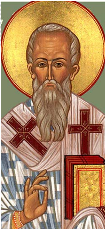
Saint Ambroise (v. 340-397), évêque de Milan et docteur de l'Église

C'est avec notre sensibilité que le Christ a pleuré, non avec la sienne, car la divinité n'a pas de larmes... Il a pleuré en cet homme qui était « triste à en mourir » (Mt 26,38) ; il a pleuré en celui qui a été crucifié, qui est mort, qui a été enseveli ; il a pleuré en cet homme...né de la Vierge.