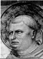
Saint Thomas d'Aquin (1225-1274)

Père plein d'amour, accorde-moi que ce Fils bien-aimé que je m'apprette à recevoir maintenant sous le voile qui convient à mon état de voyageur, je puisse un jour le contempler à visage découvert et pour l'éternité, lui qui, étant Dieu, vit et règne avec toi dans l'unité du Saint Esprit dans les siècles des siècles. Amen.