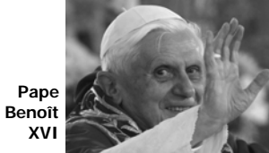
Pape Benoît XVI

de la Pentecôte par la puissance de l'Esprit Saint, ont commencé à rendre témoignage au Seigneur mort et ressuscité. Depuis, l'Eglise poursuit cette même mission, qui constitue pour tous les croyants un engagement permanent auquel il est impossible de renoncer.