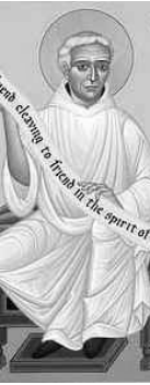
Saint Aelred de Rievaulx (1110-1167), moine cistercien

Il a demandé à Jean Leonetti, rapporteur de la commission, de « convaincre son groupe » d'évoluer sur ce point d'ici la fin de la navette parlementaire. « La solution raisonnable, c'est d'autoriser les recherches sur les cellules souches embryonnaires car elles sont utiles pour la recherche fondamentale », a-t-il déclaré. Dans une tribune parue dans Le Monde.fr, Najat Vallaud-Belkacem, secrétaire nationale du Parti socialiste aux questions de société, a déclaré : « Le désir d'enfant n'est pris en charge dans la société que pour les familles conformes au modèle traditionnel de la famille, composées d'un père et d'une mère. Il est temps de s'affranchir de cette définition naturaliste de la famille ». (...)