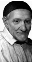
Saint Vincent de Paul (1581-1660), prêtre

que pour les voir faites. Notre Seigneur veut que devant tout nous cherchions sa gloire, son royaume, sa justice, et, pour cela, que nous fassions notre capital de la vie intérieure, de la foi, de la confiance, de l'amour, des exercices de religion..., des travaux et des peines, en la vue de Dieu, notre souverain Seigneur... Si une fois nous sommes ainsi établi en la recherche de la gloire de Dieu, nous sommes assurés que le reste suivra.