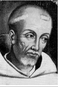
Saint Bernard (1091-1153), moine cistercien et docteur de l'Eglise.

« Pourquoi, maintenant, te désoler, ô mon âme, et gémir sur moi ? » Penses-tu trouver en toi aussi une place pour le Seigneur ? Et quelle place en nous est digne d'une telle gloire, et suffit-elle à recevoir sa Majesté ? Puissé-je seulement l'adorer aux lieux où se sont arrêtés ses pas ? Qui m'accordera de pouvoir au moins suivre les traces d'une âme sainte « qu'il s'est choisie pour son domaine » ? Cependant puisse-t-il aussi daigner répandre en mon âme l'onction de sa miséricorde, si bien que je sois capable de dire, moi aussi : « Je cours dans la voie de tes volontés, car tu mets mon cœur au large ». Je pourrai peut-être, moi aussi, montrer en moi, sinon « une grande salle toute prête, où il puisse manger avec ses disciples », du moins « un endroit où il puisse reposer sa tête »...