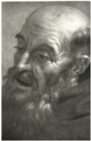
Saint Laurent de Brindisi (1559-1619), capucin, docteur de l'Eglise

(Rm 8,29). Le Christ a vraiment rendu à César ce qui est à César, et à Dieu ce qui est à Dieu. Il a observé de la manière la plus parfaite les préceptes contenus dans les deux tables de la loi divine « en devenant obéissant jusqu'à mourir, et à mourir sur une croix » (Ph 2,8), et ainsi il était orné au plus haut degré de toutes les vertus visibles et cachées.