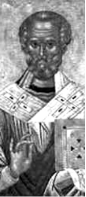
Saint Pierre Chrysologue (v. 406-450), évêque de Ravenne, docteur de l'Eglise

Mais quand on l'a semée, elle grandit et dépasse toutes les plantes potagères