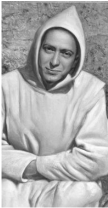
Saint Raphaël Arnaiz Baron (1911-1938), moine trappiste espagnol

« Si quelqu'un veut marcher derrière moi..., qu'il prenne sa croix, et qu'il me suive »