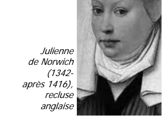
Julienne de Norwich (1342- après 1416), recluse anglaise

et tous ses saints, à tout jamais... La sera la plus haute joie : voir que Dieu lui-même en est l'auteur. L'homme, lui, n'est autre que pécheur. Il me semblait que notre bon Seigneur me disait : « Vois donc ! N'y a-t-il pas là matière à humilité ? N'y a-t-il pas là matière à aimer ? N'y a-t-il pas là matière à te connaître toi-même ? N'y a-t-il pas là matière à te réjouir en moi ? Alors, par amour pour moi, réjouis-toi en moi. Rien ne peut me plaire davantage. »