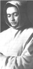
Saint Raphaël Arnaiz Baron

Le Fils de Dieu rejette la tentation d'autres voies et obéit à la volonté de son Père.