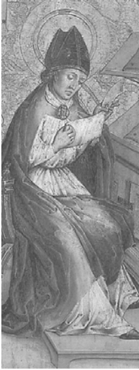
Saint Ambroise (v.340-397), évêque de Milan et docteur de l'Eglise

ne pouvons pas l'égaliser, le Seigneur Jésus sait venir en aide aux faibles. Là où il n'y a personne qui sache préparer un repas, amener du parfum, apporter avec soi une fontaine d'eau vive (Jn 4,10), il vient lui-même.