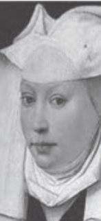
Julienne de Norwich (1342-après 1416), recluse anglaise

me semble-t-il ; il la prend avec une grande reconnaissance et une grande joie, et il l'emporte en plein ciel et la dépose dans un trésor où elle ne périra jamais. Elle est là devant Dieu et tous ses saints, continuellement reçue, continuellement nous aidant dans nos besoins. Et quand nous entrerons dans la béatitude, elle nous sera rendue, contribuant à notre joie, avec des remerciements infinis et glorieux de la part de Dieu.