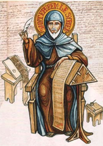
Saint Ephrem (v. 306-373), diacre en Syrie, docteur de l'Église Commentaire de l'Évangile concordant, 15, 15-17 ; SC 121 (trad. SC, p.273 rev.)

bonne volonté ; si on l'avait embauché, il aurait travaillé, mais « personne ne nous a embauchés. » Ce que nous donnons à Dieu est bien indigne de lui, et ce qu'il nous donne bien au-delà de ce que nous méritons. On nous embauche pour un travail proportionné à nos forces, mais on nous propose un salaire tout à fait disproportionné... Il agit de la même façon envers les premiers et les derniers ; « ils reçurent chacun une pièce d'argent » portant l'image du Roi. Tout cela signifie le pain de la vie (Jn 6,35), qui est le même pour tous ; le remède qui donne la vie est le même pour tous ceux qui le prennent. Dans le travail de la vigne, on ne peut pas reprocher au maître sa bonté, et on ne trouve rien à redire de sa droiture. Dans sa droiture, il a donné comme il avait convenu, et dans sa bonté, il s'est montré miséricordieux comme il l'a voulu. C'est pour enseigner cela que notre Seigneur a prononcé cette parabole, et il a résumé