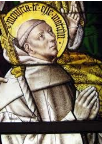
Saint Bernard (1091-1153), moine cistercien et docteur de l'Eglise

Que faites-vous, mages, que faites-vous ? Vous adorez un enfant à la mamelle, dans une chaumière vulgaire, dans des langes misérables ? Celui-ci serait-il donc Dieu ? Mais « Dieu réside dans son temple saint, le Seigneur a son trône dans les cieux » (Ps 10,4), et vous, vous le cherchez dans une vulgaire étable, sur le sein d'une mère ? Que faites-vous ? Pourquoi offrez-vous cet or ? Celui-ci serait-il donc roi ? Mais où est sa cour royale, où est son trône, où est la foule de ses courtisans ? Une étable est-elle un palais, une crèche un trône, Marie et Joseph les membres de sa cour ? Comment des hommes sages sont-ils devenus fous au point d'adorer un petit enfant, méprisable tant par son âge que par la pauvreté des siens ?